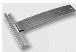
Tirante acero Ref: 023002000