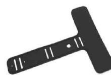
Protección goma tirante Ref: 023013000