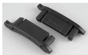
Tapón lateral nylon Ref: 021010001